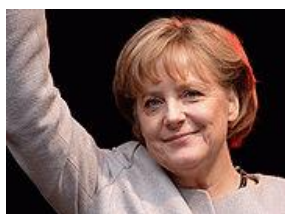
Überzeugte mit Argumenten, Sachlichkeit und Anstand: Bundeskanzlerin Angela Merkel.