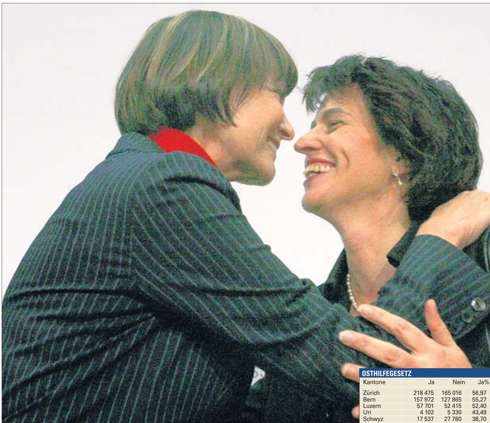
FREUEN SICH ÜBER DEN SIEG Die Bundesrätinnen Micheline Calmy-Rey und Doris Leuthard.