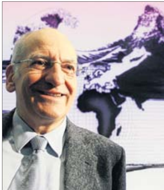
PASCAL COUCHEPIN ist zufrieden.

Im Kanton Aargau werden 30 Franken mehr für Kinder bis 16 Jahre ausbezahlt, für Jugendliche in Ausbildung (bis 25 Jahre) steigt die Zulage gar um 80 Franken an. Ähnlich ist die Situation im Kanton Basel-Stadt: Hier steigen die Zulagen ebenfalls um 30 respektive um 60 Franken an. Im Kanton Baselland verändert sich nur die Ausbildungszulage, die heute bei 210 Franken liegt. Sie wird um 40 Franken erhöht. Die Kantone Bern und Zürich unterscheiden heute zwischen Kindern unter und über 12 Jahren: Bis 12