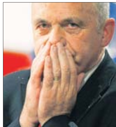
UELI MAURER «Das Resultat ist ein Fehlentscheid.»

Ansonsten hatte er nichts zu lachen: «Die Schweiz wird in Zukunft ohne Ende bezahlen, aus dieser Falle werden wir nicht mehr herauskommen», malte Maurer gestern tief schwarz. Er bezeichnete das Resultat als etwas weniger schlecht als befürchtet, aber es sei nach wie vor ein Fehlentscheid. Es reichte nicht für ein Nein, weil die SVP wie fast immer allein gegen alle anderen antreten musste. Als Absage an den bilateralen Weg will Maurer seine Haltung nicht verstehen: «Es ging um eine finanzielle Frage, nicht um eine bilaterale.» Mit den bevorstehenden Beitritten von Bulgarien und Rumänien sowie dem Finanzierungsabschluss der EU im Jahr 2014 werde